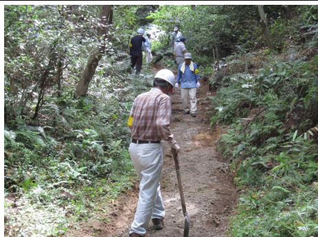
9/15ゆうゆうの道 After 補修作業