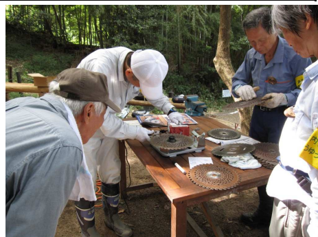
9/15チップソーの目立て (刈払機のカッター)