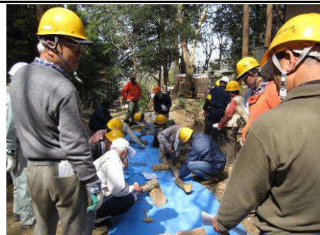
3/24 養成講座椎茸ホダギ作り