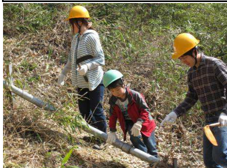
3/16 桜とつつじの森づくり支援