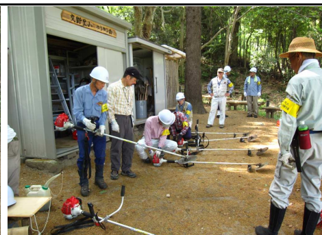
5/26 刈払機の作業前点検(倉治公園の草刈り)