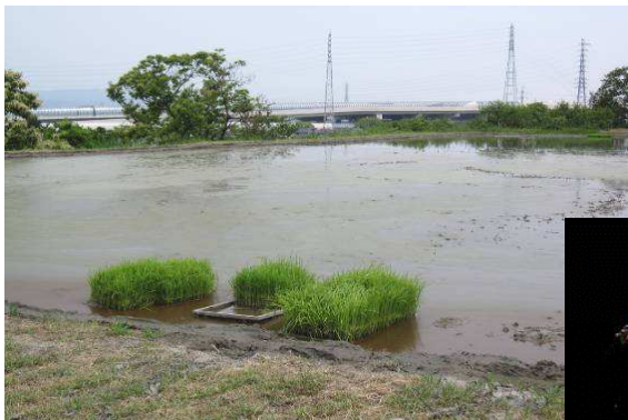
梅雨入りでも雨は降りませんが田植えの季節です 写真上