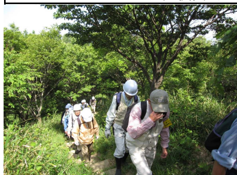
5/18 みはらしの道から小鉄塔經由石仏の道北斜面へ(竹伐り)