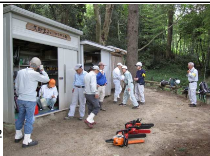
チェーンソー実習