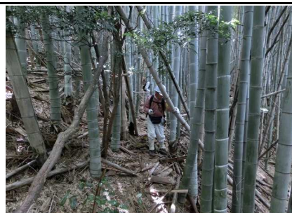
古い竹伐採と整理