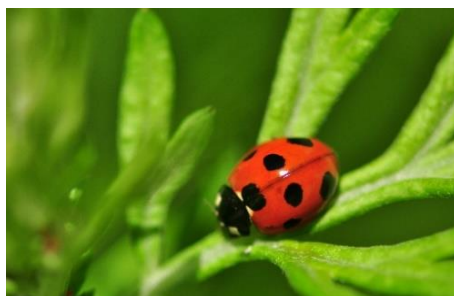
ナナホシテントウムシ