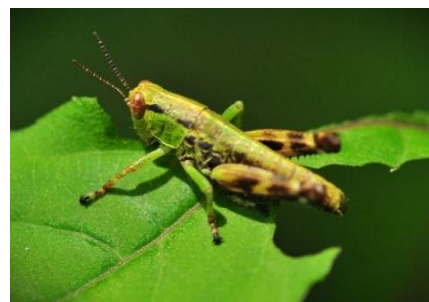
トノサマバッタの幼生