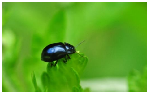
ヤナギルリハムシ