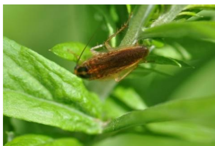
モリチャバネゴキブリ