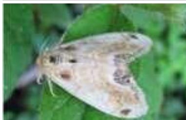
ヒメシロモンドクガの成虫 (参考)