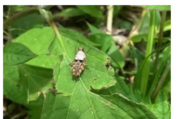
ヒシバッタの仲間