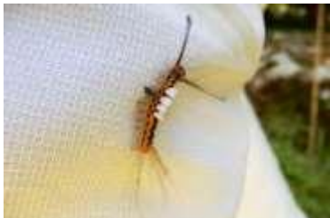
ヒメシロモンドクガの幼虫