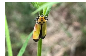
ツマグロオオヨコバイ