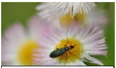
クビホソジョウカイ属