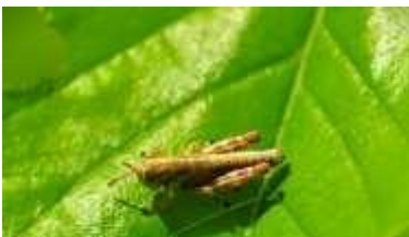
ヒシバッタの幼生