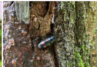
ヨツボシケシキスイ