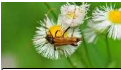
ツماغロハナカミキリ