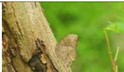
クロコノマチョウ