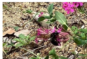
台湾タケクマバチ