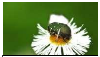
コアオハナムグリ