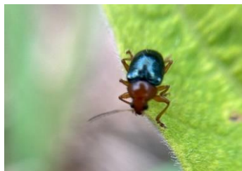
アオバネサルハムシ