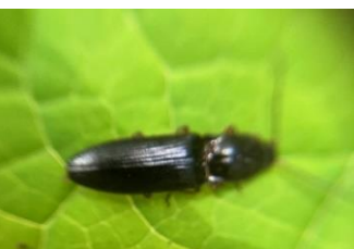
クロツヤハダコメツキ