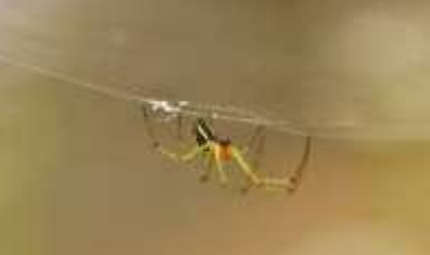
ココシロガネグモ