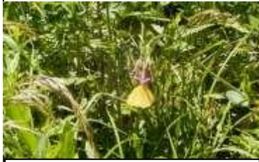
ムシトリナデシコ来た たツマグロキチョウ

写真以外にも作業中にクロアゲハ系、モンシロチョウ、アオスジアゲハ等を見ることが出来ました。