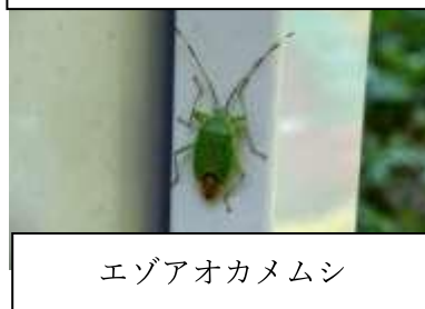
エゾアオカメムシ