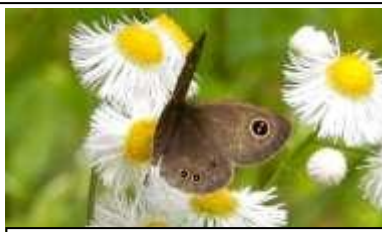
ハルジオンに来た ヒメウラジャノメ