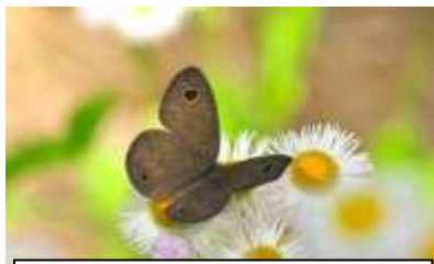
ヒメウラナミジャノメ

汗ばむ陽気の中、1時間半程観察した結果写真の虫達を見ることが出来ました。オオスズメバチが樹液を吸いに来っていたので今後注意が必要です。