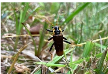
キンイロジョウカイ