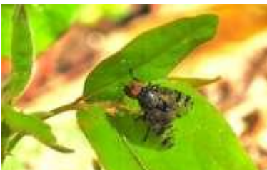
ハマダラヒロクチバエ?