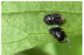
クロチビタマムシ