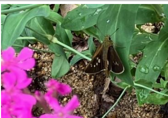
イチモンジセセリ