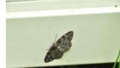
ハスミエダシャク