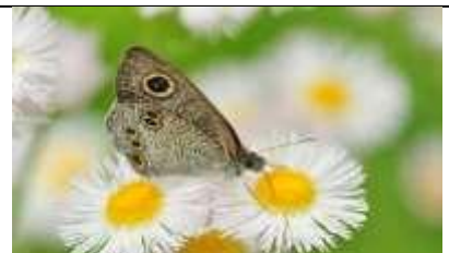
ヒメウラナミジャノメ