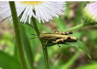
ヒシバッタの幼生