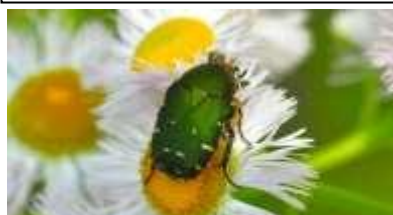
コアオハナムグリ