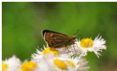
コチャバネセセリ