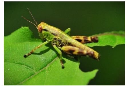
トノサマバッタの幼生