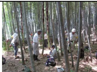
整 倉 備 小 竹 林 5/20