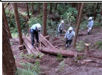
活 動 エ ン ソ ー 5/16