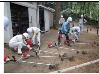
刈 倉 治 公 園 草 6/1