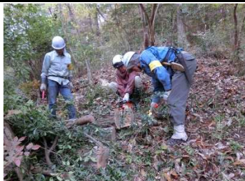
モニタリング地の雑木伐