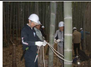
里山保全推進員養成講座