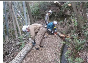
間道にて 枯れ木の伐採 4/2