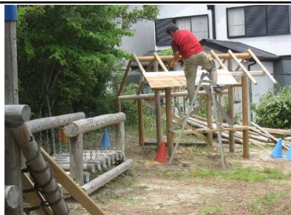
ほしだ幼稚園 小屋製作 6/27