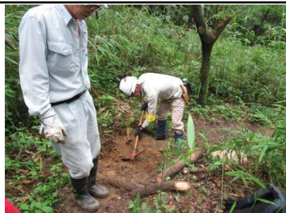
ゆうゆうの道 階段補修 6/28