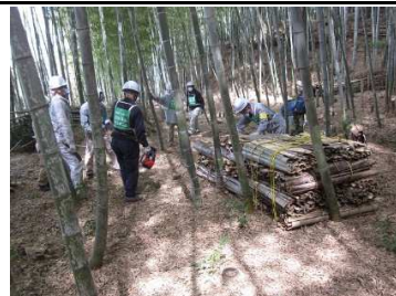
倉 小 竹 林 整 備 3/20