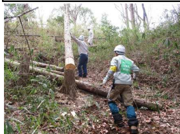
活動 チェーン ソー チーム 3/16