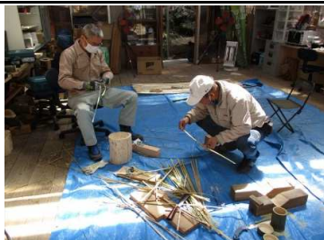
金曜 広場 3/19